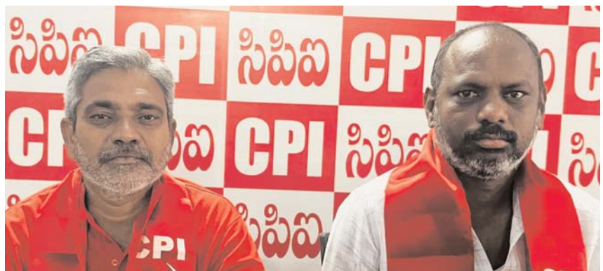
రీ సర్వే చేస్తే 20% మంది కూడా అర్జులు ఉండరని ఇది ప్రభుత్వాన్ని ప్రజలను అధికారులు తప్పుదోవ పట్టించడమేనని వారు విమర్శించారు. ఒక్కో డివిజన్లో 100 నుండి 500 వరకు అర్జుల లిస్టును చూస్తే అధికారుల పనితనం మనకు కనబడుతుందని అన్నారు. కరీంనగర్ నగరంలో జరిగిన ఇందిరమ్మ ఇండ్ల సర్వే అసబద్ధంగా ఉందని సరైన జవాబిదారితనం అధికారుల వద్ద లేదని సర్వేలో జరిగిన అక్రమాలపై విచారణ జరపాలని వారు ప్రభుత్వాన్ని డిమాండ్ చేశారు. ఈ యొక్క లబ్ధిదారుల ఎంపిక ఏ విధంగా చేశారో అధికారులు చెప్పాలని వారు కోరారు.