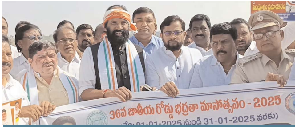
రోడ్డు భద్రత బ్యూనర్ల ఆవిష్కరణ

తెలుగు దినపత్రిక | కరీంనగర్ | గురువారం 23 జనవరి 2025 | పేజీలు 7