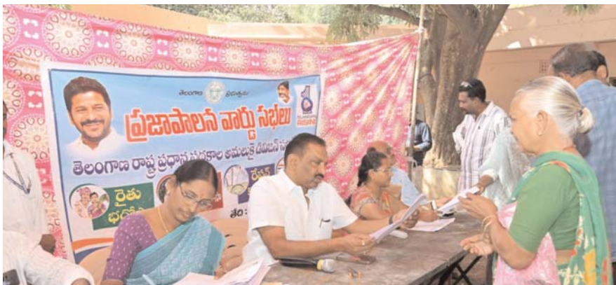
దరఖాస్తులను స్వీకరించే ప్రక్రియ చేపట్టామని తెలిపారు. మొదటి రోజు 1 వ డివిజన్ నుండి 30 వ డివిజన్ వరకు దరఖాస్తుల స్వీకరణ ప్రక్రియ ముగిసిందని... ఈ రోజు 31 నుండి 60 డివిజన్ వరకు దరఖాస్తులు స్వీకరించామని తెలిపారు. ఇందులో భాగంగా నే మేము ప్రాతినిధ్యం వహిస్తున్న 33 వ డివిజన్ లో ప్రజాపాలన వార్డు సభ నిర్వహించి దరఖాస్తులు స్వీకరించామని తెలిపారు. సంక్షేమ పథకాలకు ప్రజలు ఇచ్చిన దరఖాస్తులను ప్రభుత్వ పరిశీలనకు పంపిస్తామని తెలిపారు. అమలు అయ్యేలా చర్యలు తీసుకుంటామని తెలిపారు.

కరీంనగర్, ఎలగందల్ టైమ్స్: ప్రభుత్వం చేపట్టిన ప్రజాపాలన వార్డు సభల్లో ప్రజలు ఇచ్చిన దరఖాస్తులను ప్రభుత్వానికి పంపి ప్రభుత్వం ఇచ్చే సంక్షేమ పథకాలను ప్రజలకు అందించే విధంగా కృషి చేస్తామని నగర మేయర్ యాదగిరి సునీల్ రావు అన్నారు. కరీంనగర్ 33 వ డివిజన్ భగత్ నగర్ పోలీస్ క్వార్టర్స్ ప్రభుత్వ పాఠశాలలో బుధవారం రోజు ప్రభుత్వ చేపట్టిన ప్రజాపాలన వార్డు సభకు ముఖ్య అతిథిగా హాజరయ్యారు. ప్రభుత్వ ప్రధాన సంక్షేమ పథకాలకు సంబంధించిన దరఖాస్తులను స్వీకరించారు. ప్రజల్లో వ్యక్తం అయిన పలు సందేహాలను తీర్చి... దరఖాస్తు దారులకు పలు సూచనలు చేశారు. వార్డు సభలో వార్డు ఆఫీసర్, అధికారులకు దరఖాస్తుల స్వీకరణ పై ఆదేశాలు జారీ చేశారు. ఈ సందర్భంగా మేయర్ యాదగిరి సునీల్ రావు మాట్లాడుతూ... ప్రభుత్వ సంక్షేమ పథకాల అమలుకు సంబంధించి ప్రభుత్వ ఆదేశాల ప్రకారం నగర వ్యాప్తంగా 60 డివిజన్ లలో రెండు రోజులు ప్రజల నుండి కొత్త రేషన్ కార్డులు, ఇందిరమ్మ ఇండ్లు, ఇందిరమ్మ ఆత్మీయ బరోసా