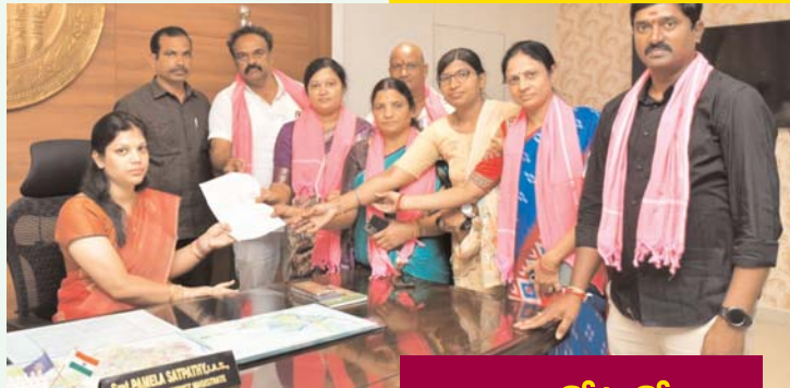
అవినీతికి పాల్పడిన మేయర్ పై వెంటనే విచారణ జరిపించాలని కోరారు. తక్షణమే మేయర్ పదవి నుండి సస్పెండ్ చేయాలని కోరారు.