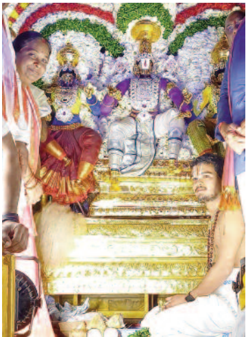
(కరీంనగర్, ఎలగందల్ టైమ్స్)

సంధ్య వేళ చల్లటి గాలుల మధ్య తొమ్మిది వాహనాలు వెంట తరలిరాగా కరీంనగర్లోని మార్కెట్ రోడ్లోని శ్రీ వెంకటేశ్వర స్వామి ఆలయంలో జరిగిన