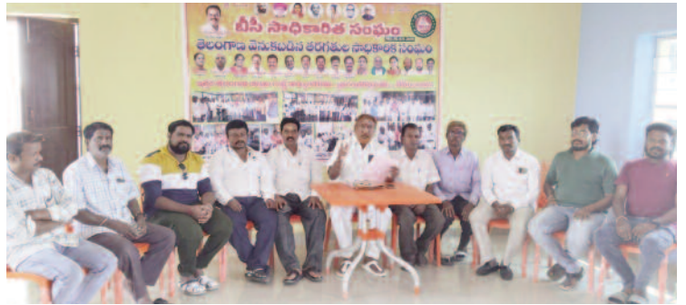
(కరీంనగర్, ఎలగందల్ టైమ్స్)

సమగ్ర కుటుంబ కుల సర్వే పారదర్శకంగా, శాస్త్రీయంగా జరుగలేదని, మళ్ళీ శాస్త్రీయంగా నిర్వహించాలని ఉమ్మడి కరీంనగర్ జిల్లా బీసీ సాధికారిత సంఘం పొలాస నరేందర్ ప్రభుత్వాన్ని డిమాండ్ చేశారు. సోమవారం వేములవాడ ఉత్తర తెలంగాణ జిల్లాలకు చెందిన బీసీ సాధికారిత సంఘం కార్యాలయంలో జరిగిన బీసీ నేతల సమావేశం లో ఆయన మాట్లాడారు. జిల్లా బీసీ సాధికారిత సంఘం కార్యక్రమాల నిర్వహణ కమిటీ కన్వీనర్ గా