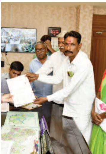
చివరి రోజున దాఖలైన నామినేషన్లు...