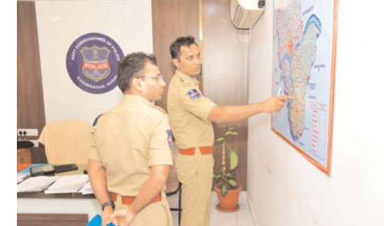
ఏసీపీ కార్యాలయాన్ని తనిఖీ చేసిన సీపీ