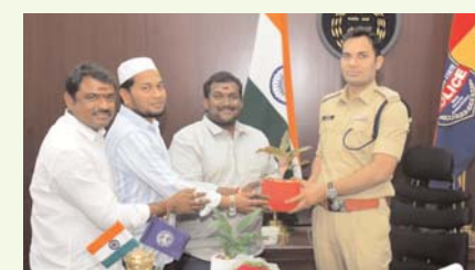
సీపీసీ కలిసిన సేవా సంస్థ సభ్యులు