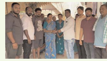
హోంగార్డ్ కుటుంబానికి సహాయం